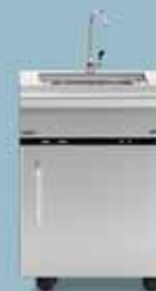
freedom 445 fregadero