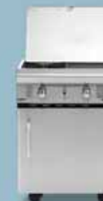
freedom 455 cocina