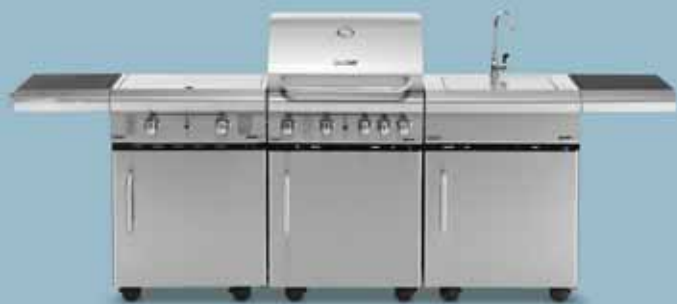
freedom 455 + freedom 321x + freedom 445