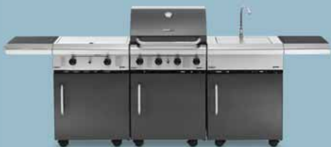
freedom 450 + freedom 321c + freedom 440