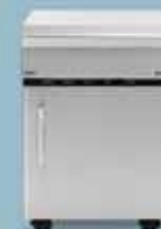
freedom 420 almacén