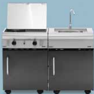
freedom 450 + freedom 440