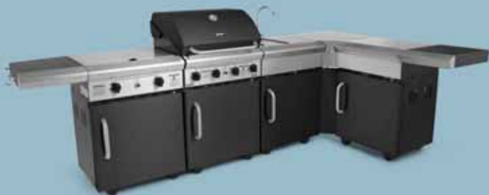
freedom 450 + freedom 321c + freedom 440 + freedom 430 esquina + freedom 420 almacén