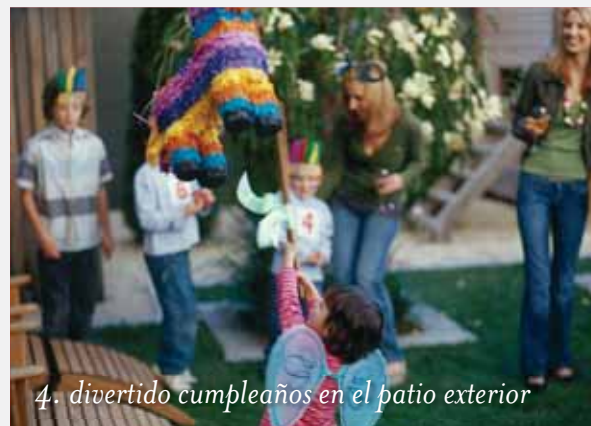
4. divertido cumpleaños en el patio exterior

todas esas otras cosas sin las que usted no puede vivir