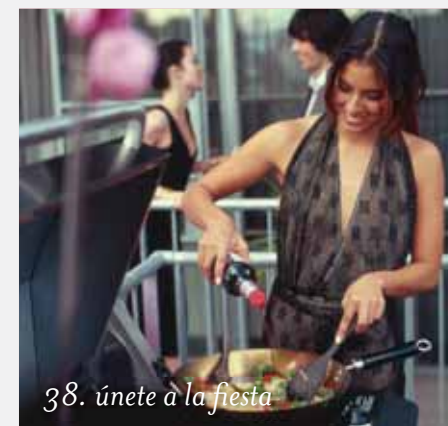
38. únete a la fiesta