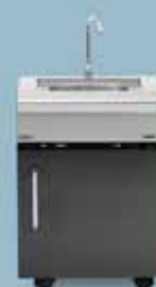
freedom 440 fregadero