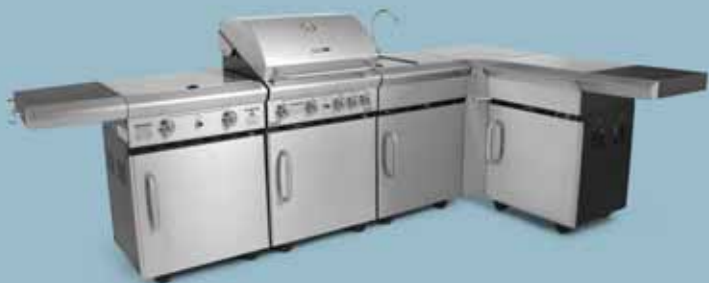
freedom 455 + freedom 321x + freedom 445 + freedom 435 esquina + freedom 425 almacén