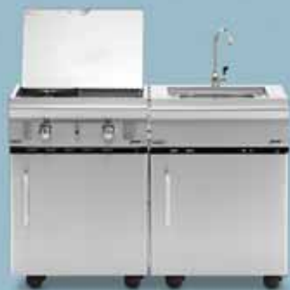
freedom 455 + freedom 445