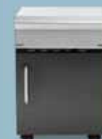
freedom 420 almacén