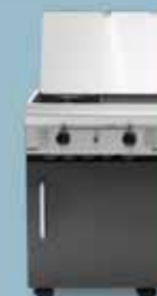
freedom 450 cocina