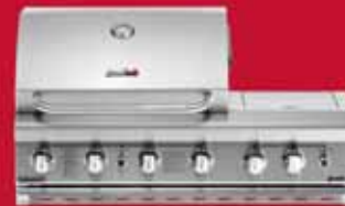
professional 482 integrado