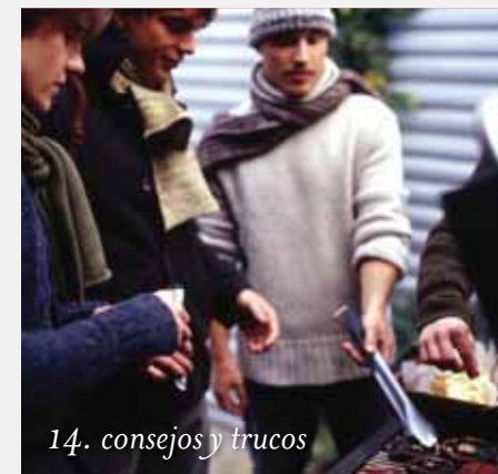
14. consejos y trucos